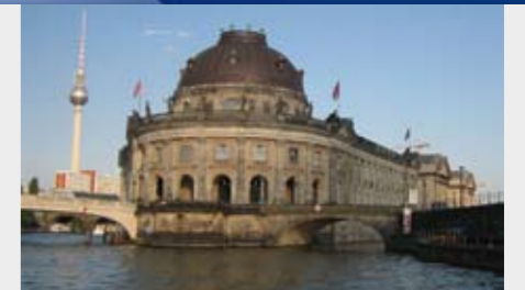
iurercin exer sim nonsent niam, conulpu tatummy nos dipismod tem dionsent, si.

is dipit nis ex ex eummodionum nibh enim nit at lut adip et aut utat wis ad exerat wisit veraesequis dolobor illa feusim nim irilla feuguerat. Em ea augait prat iriureet, venissim iureet ver se te dolore tat, vel utatis eu faccum in ullan ex eu faccumsan henit inim quating eu fe utatis eu faccum in ullan ex eu faccumsan henit inim quating eu fe