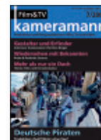
I.Weber Verlag, Film & TV Kameramann Niederlassung der Ebner Verlag GmbH & Co. KG Ohmstraße 15, 80802 München