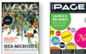
Redaktion PAGE Niederlassung Ebner Verlag GmbH & Co. KG Borselstraße 28/Haus i, 22765 Hamburg