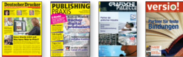
Deutscher Drucker Verlagsgesellschaft mbH & Co. KG Riedstraße 25, 73760 Ostfildern