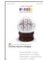
Werbe- und Verlags-Gesellschaft Ruppert mbH Trakehner Straße 7–9, Bürohaus A D-60487 Frankfurt/Main