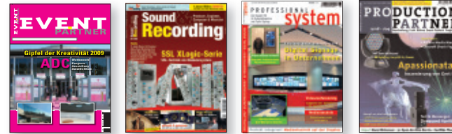
MM-Musik-Media GmbH & Co. KG Niederlassung Köln Emil Hoffmann Straße 13, 50996 Köln