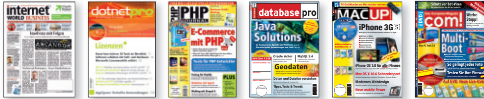
Neue Mediengesellschaft Ulm mbH Bayerstraße 16a, 80335 München

mediensucher „An mediensucher führt kein Weg vorbei!“ Diese Fachmagazine beteiligen sich an der regelmäßigen Bewerbung von mediensucher in deren Printausgaben.